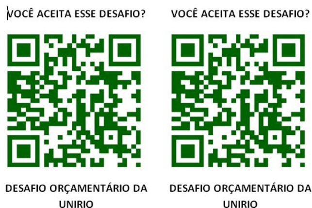
Figura 5 – Reprodução do Cartaz