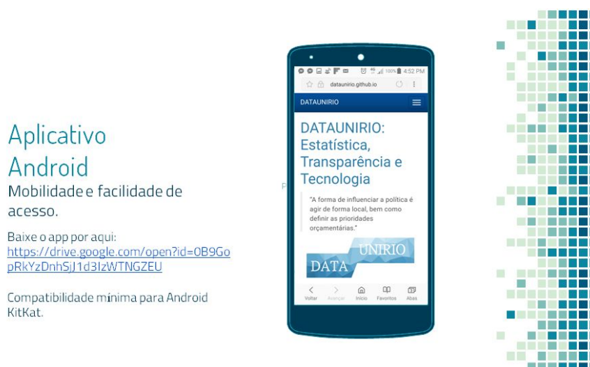
Figura 4 – O orçamento no celular Fonte: Os autores

KitKat). Isso aumenta a mobilidade e a facilidade de acesso. A ideia é que as pessoas podem levar o Orçamento da Universidade no bolso.